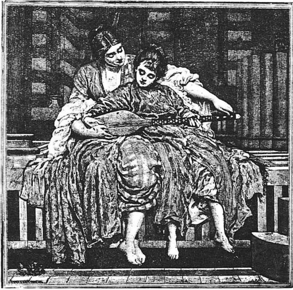
Τό Μάθημα τής Μουσικής (Έργον τού Σιρ Φρειδρίκου Λάιτου)