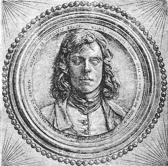
"Ο διάσημος Ἀγγλος γλύπτης καὶ ζωγράφου Φλάμαν. (Έργον τοῦ Μισσελερ)