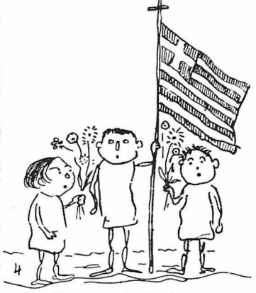
Με τή σημαία εμπρός...