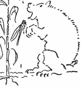
Κ' ή άρκοϋδες τρώγανε τά καλάμπόκια.

Όι συντροφοί μας, μόλις άκούσαν τό τραγούδι για