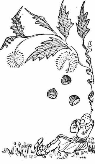
'Η καστανιές κάνανε άρθωνα τά κάστανα.

—Να, αλλά μιά που τήναμε «αρχές» και τόσο άλλο κριόο έδώ, γιατί νά μιν έποφελήθω τής περιστάσεως, και νά μιν κάωω μιά φορά κ' έγώ, εξετάσεις όπως πρέπει;