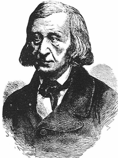
Ό Γερμανός Μυθογράφος Γουλιέλμος Γκριμ