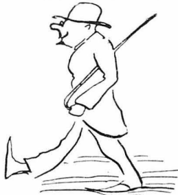
'Ο γυιός του κύρ-'Αντρέα

(Συνέχεια και τέλος) 'Αφού φώναζε να ξελαογγυίστηκε η επιτροπή των Καλλιστείων κ' αφού ζήτησε καθ' ένας να βγάλει τη δική του «Μίζ», έπειτα άρχισαν να βρίζουν ό ένας την μίζ του άλλου: