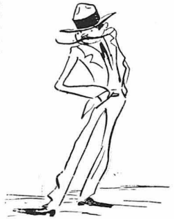
'Ο Τάσος ό 'Ανάκτορος

τόν Νάσο, τ' ανατάκι, όπου ένδιασφέρεται για κάποιο... Βασανάκι, και διά φόου άπειλεί να έκλεψή ως Μίς ή Σόσσα του Γιορζακόπουλου, κ' ή κόρη της Μαμής!