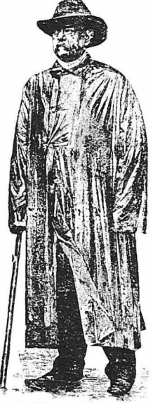
Ο Βισμαρκ στην έξοχη

Και, λέγοντας αούτα, σφύριζε στο σαλί τού και έφυγε χωρίς άλλες διατυπώσεις, άφροντας τού φτωχό Βιλντστάτς να ξελασποθή στην όχη τού βάλλο.