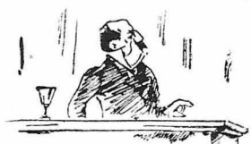
Ο Χ. Τριχοπούης (Σκίτσο του ε'Ασμοδαίου)