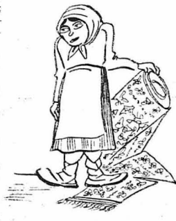
— Διατί να μη άποστειλωμεν μιαν ταπητουργών;...