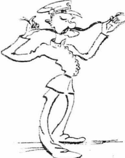
Διμήτριος στον μουστακίω τό στρώψιο...

Ποιός γνώριζε καλύτερα τι θα ήθελον, από τον κ. Οικονομικό Έφορο, που κανόνιζε τις περιουσίες των κατοίκων, ή άτι τον κ. άνθισπαστή της χωροφυλακής, που έβαζε τις διατιμήσεις στα τρούφια, ή άτι τον κύριο Δικαστή, που έπαιξε παντογνωσιακά στα δάχτυλα τους Νόμους, ή άτι τον κ. Έπαρχο, ο οποίος περπατούσε σαν να χόρευε σπών-ντε.