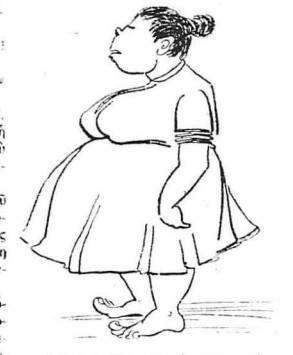
Δείγμα της γονιμότητος και της παραγωγής της χώρας.

— Και ή άνευη τά κύριον βουλευτού του τότου μας, που ευεργέτου τότου, πρέπει να περιφρονήθη! Θύροβος μεγάλως άρχισε πλέον εκεί μέσα. Στις φωνές, στα γρονθο-