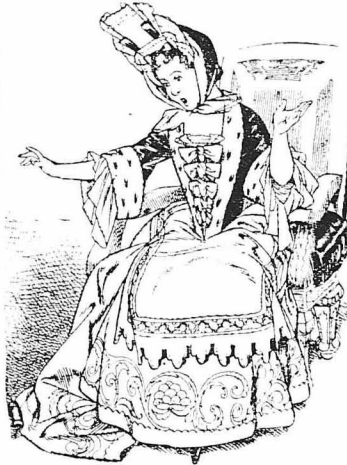
— Ἐ, ναι λοιπόν, ἀγαπᾷ, ἀγαπᾷ πραγματικά αὐτὴ τὴ φορὰ!... εἶπε ἡ Ἀλίκη.