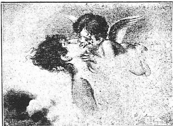
Τὸ φιλμὰ τοῦ "Ἐρωτὸς" (τοῦ Βίλχεμ Μάρτενς)

Ξέρω πὺς μοῦ ἦσαν αὐτὴ τὴ στιγμὴ στὸ νοῦ ζάτοιμο ἰσπορσοῦ στίχοι τῆς κόμισσας Ντέ Νουάι: "Ἦθελα νὰ μόνι μιὰ χλωμὴ ζητιάνα, κ' ἀπὸ τὰκοῖσὸ σου τὸ χέρι νὰ πᾶταρα γωαί, καὶ νὰ ζῶ μονάχα ἄν' τὸ ἔλεός σου!"