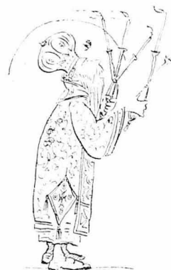
Με τά δικεροχειρά στα χέρια.