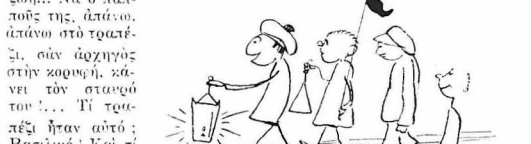
— Νά τά ποήμε ;

Μά νάτος που γήρασε ζωντανός και ζωηρός, με τό κόκκινο τό τασιστό του φέσι και τά τσόγινα τά βαθινγάλας ετοιμάνια του... Κάτι έχει στο μαντήλι. Πετοκαλάια!... Κίτρινα, όλόχρωνα, που λείπουν σάν ένας ήλιος τό καθένα... Κι' ή λάμψη τους φωτίζει την προσημένη της ζωή... Νά ό παιπούς της, άπάνω στο τραπέζι, σάν άρχηγος στην χορωή, κάνει τόν σταυρό του!... Τί τραπέζι ήσαν αυτό; Βασιλάκι! Και τί δέν ήσαν άπάνω! Και ό παιπούς της κάνει