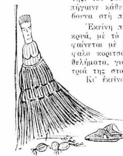
Η σκούλα σάν παλιά νιοκουρά με τά πλατιά και μακρά φουστάνια.

"Όλα, μιά όλα, έχει μέσα, είχαν έφραδηί... "Ένα τσοκάλι, χτυπημένο στά χειλή του, μαύρο από τί φωτιά και κακοδολεμένο, τίς θωμάζε τίς γειτονιά της, τόν Τούρκο καρβουνιά, που τίς πήγαινε κάθε παραμονές σακιάά-σακιάά τά κάρβουνα στη πλάτη φορτωμένο.