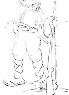
Κάτι άνθρωποι λυγίσθηδες και μαλλισροί.

Η... Τώρα είχε ξεμειώσει για γιά. Η βροχή είχε σταματήσει. Ομίχλη είχε μαζένει στα βουνά, πουχεν ένα βαθύ χρώμα γαλάζιο και τα νερά άσπριζαν στους δρόμους. Περάσανε λίγο φωνή για να γάιε, αλλά οι εύχωνοι δεν είχαν. Είταν τότε να τους δώσουν απ' τις γαλέτες του κάρου. 'Ο Μίχος όμως άναπατάθηκε.