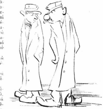
Φουδόντουσαν να πάν στον πόλεμο...