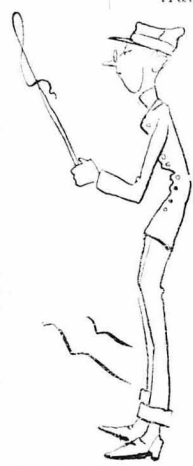
Άφωφ και οι τραπέζιτοι υπάλληλοι ξεκιναν μουλγαδές.