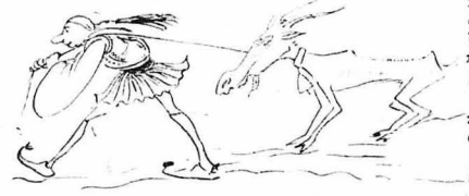
Είχαν πετύχει κάποια γίδα.

— Κύρ δεκανέα, πάρε σέ παρακαλώ. — Τι είναι, βοέ; Μωφ έδωσες ένα με γάλο