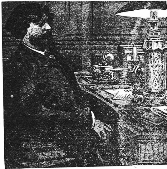
Ο 'Αλφόνος Ντωντέ.