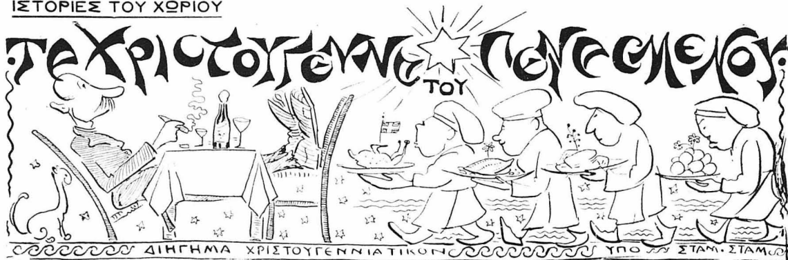
ΔΙΗΓΗΜΑ ΧΡΙΣΤΟΥΓΕΝΝΙΑΤΙΚΟΝ ΥΠΟ ΣΤΑΜ. ΣΤΑΜ.