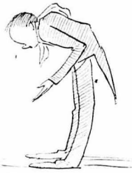
Τὸ γκαρσόνι ὑπεκλίνετο

"Όπως σέ βλέπω και με βλέπετε. Αὐτὸς εἶνε και