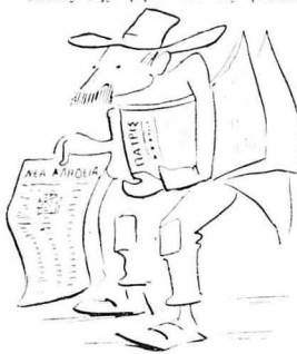
Έπηρε να πωλήση μερικάς εφημερίδες.

Μόλις είχε βγει από τις φυλακές της Θεσσαλονίκης όπου τον είχαν κλείσει για κάποια απειθαίρεση του ποδοσφαιρικού του έθνους... τσέπη ενός παρακαθημένου του στο τραίνο, κι' έζητησε να βοηθού τους παλιούς του φίλους. "Έγραφε σ' όλα τα χαρτίνα και στα χέρινα τα παραθαλάσσια, αλλά δεν συναντήσε κανένα. Τι να έγιναν; Μήπως τους πάσανε κι' αυτούς ή μήπως υπέφεραν τήν δράση τους σ' άλλας πόλεις;..."