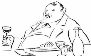
‘Ο κ. Διευθυντὴς τὴς «Πανελληνίου Τραπεζῆς».