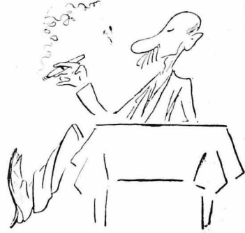
Ζήτησε και ένα ποῦρο.