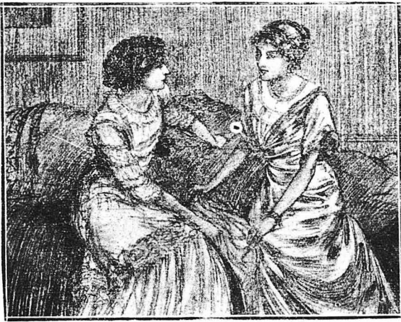
ΓΙΑΒΕΡΤΗ.— Γιάτι δεν μου λές είν' αλήθεια; Σ' άπατά ο άντρας σου;...

ΕΛΕΝΗ.—Ναί, παιδί μου. (Φιλεί το μικρούλη).