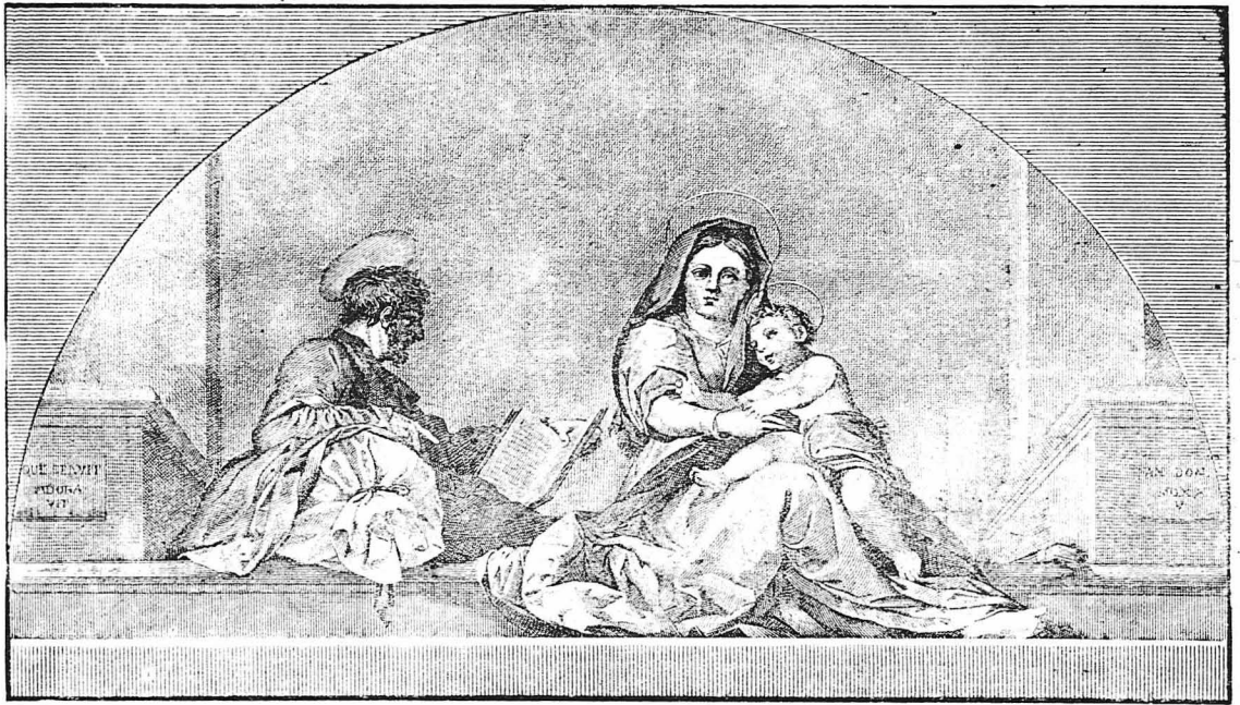
ΧΡΙΣΤΟΣ ΓΕΝΝΑΤΑΙ ΣΗΜΕΡΟΝ...