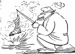
Ήταν σαν ένα παράξενο λιθάνιστηρι.