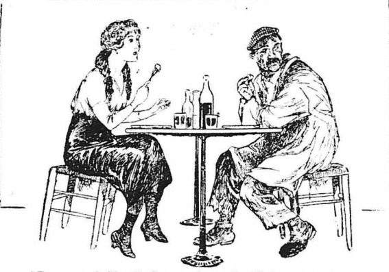
Έτρωγε κα' άδειασε όσα ποτήρια της έβαζε μπροστά της...