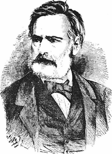
'Ο Βικτωρ Ούγκω