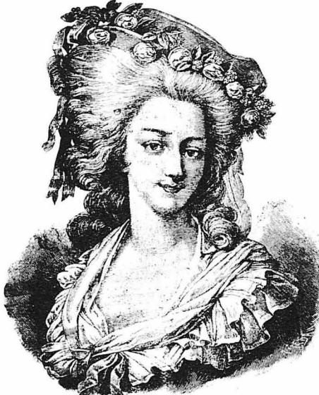
Η όραιοτάτη πριγκήμισσα Λαμπαλά, ή όποια κατακρουρηγήθη από τόν όχλο κατά την Γαλλική επανόστασι.