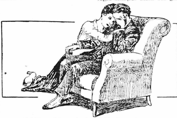
ΕΜΜΑ.— Θέλεις να φύγω ή θα με σκοτώσεις ;...