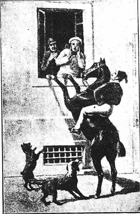
Κι' όταν το παράθυρο άνοιγε, έκανε θριαμβευτικά την εισοδό του στο σπίτι!...

Κατά το 1850, ο Καθαλλός του Διαβόλου, άπως τον είχαν ένομιονάσει οι σύγγρονοι του, αφού πέρσασε τη νεότητά του με γλέντια και διασκεδάσεις, είχε μεταληρήσει πια σε άνθρωπο οκάος. Έχει τρελλάθει και τον είχαν κλείσει σε μιά φρενολομική κλινική. Στην κατάσταση δέ αυτή έζησε τριάντα χρόνια περίπου, άς άπου πέ-