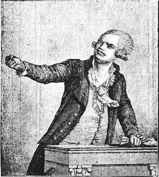
Ό Δαντών άγορεύουν στήν Έθνοσυνέλευση.

ΖΑ.Ι.ΡΑ.— Ωραία, Μάρκο!... Έσύ είσαι άντρας! Έσύ προστάτης, δεν παρακλιείς!... Έσύ σκλαβώνεις, δεν γίνεσαι σκλάβος!... Έσένα θέλω!... Έσένα άγατώ!... (Πέφτει στήν άγκαλιά του).