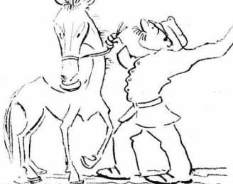
- Αν δεν σου τραβήσω χαμιά στά νεφρά να μη με λένε Μιχο!...

Τραβούσαμε, τραβούσαμε κι' άζωμα να φανή το χάνι. Είχε νυχτώσει για καλά και στον ορίζονθό θά ήτανε φεγγάρι, γιατί, χαρά τι συννεφιά, θεμτόφ-φεγγε δλη ή γύρω έκτασις.