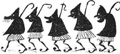
'Ενας μαύρος όμιλος έχοχότανε από την άλλη άκρη του δρόμου.

Οι γυλιοί μας είχανε φουσκώσει από το νερό και μας είχανε κοφωμοειάσει. Οι σύντροφοί μας προθυμοποιήθηκα να να τα σακιά και τις μπαλάσσες.