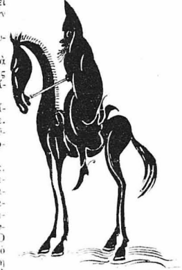
'Ηταν ένα σκοτεινό και ασχηλό μυστήριο...

- Άιντε, όρέ, ναιρέυτρες και μένε! είπαν οι φαντάροι στον καρροτσέρη.