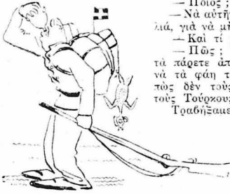
Θάσσο, Θάσσο δεν θα σε ξεχάσω!

- Στο πρώτο Τουρκικό χωριό δέξια, έρχομε τενεκεδες βουτούρα κρημινισα σε μια άχυριδινα! με φωνάζαν για τελευταία φορά οι χωριάτες φεύγοντας.