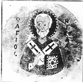
Ὁ Ἅγιος Νικόλαος (Μουσεῖον Καλῶν Τεχνῶν Βοστώνης)

Τὰ διάφορα σινεξάρια διηγούναι πολλὰ θαύματα τοῦ Ἁγίου Νικόλαου, ὅλα ὅμως αὐτὰ φαίνεται ὅτι πηγάζουν ἀπὸ τὸ ἐπισημὸν ποῦ συνέβη τὸν Ἱεράρχη τῆς Λυκίας, σ' ἕνα ταξεῖδι του, ἀπὸ τὴν Ἀγυπτὸν πρὸς τὴν Ἱερουσόλυμα.