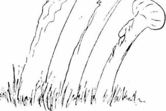
"Εμοιάζαν με πεθαμένους που..."

Αυτό τού έλεγε για μένα, που χάζενα με τή λουλουδιά, γιατί ήταν πατριώτης και νόμιζε πως κρατούσε άπ' τούς άρχαίους Έλληνας.