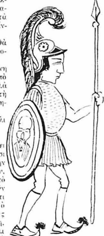
"Ό Σπυράκης νόμιζε πως ήταν άρχαίος "Ελληνας."

Λίγη ώρα πριν από μιάς είχε κινήσει από την Κοζάνη, προς την ίδια διεύθυνση και μιά διλοχία από τόν Κονταράτο, στην όποιαν ήταν και τού παιδι τού Βενζέλου, ό Κυριάκος. Έρχόντουσαν, δέν έξομο από τού βιαστικοί, για νά προστάσουν να ιπών στην Θεσσαλονίκη. Στη Κοζάνη μάθαμε ότι ό γυιός τού προμητοργού υπέφερε στη δρόμο φοβερά, από τού χιονι, τής λάσπης και τού κρύου. Δέν σταβησαν στη Κοζάνη, ούτε νά πάρουνε άναπαυή και πήγαν πάλι τόν μαζρά κι' άνηφορο καζόδρομο, που