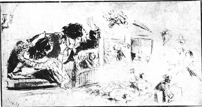
Πάνω στον ένθουσιασμό, ό φιλόμνος κύριος πετάει στην πρωταγωνίστρια και τήν βεντάλια τής κυρίας του. (Γελοιογραφία του Σαμ)

ή πρώτη παράστασις του «Δούγκριν» στο θέατρο «Έντεν» του Παρισιού, δέκα χιλιάδες Παρισινοί απέκλεισαν το θέατρο και άρχισαν να τραγουδούν τή «Μασσαλιωτίδα», αποδοκίμαζόντες με κάθε τρόπο το Βάγνερ και τους Γερμανούς. Η ειδική φρουρά που είχε διατεθεί εκείνο τή βράδυ για τήν τάξη, αναγκάστηκε να κινή επανειλημμένα εφόδους για να διαλύσει τή μαυνομένο αυτό πλήθος. Συνέλαβε μάλιστα 900 άτομα και έπει ή θείλια έκοπασε κάπως και μπόρεσε ν' άρχισή ή παράστασις. Μά τήν άλλη μέρα, επειδή ύπληξε φόβος να γίνον τή ίδια και χειρότερα, άπαγορεύθηκε τή παίζεση του «Δούγκριν». Το έργο αυτό του Βάγνερ ξαναπαίχτηκε στο Παρίσι στις 16 Σεπτεμβρίου 1891, στην «Όπερα». Στην πρεμιέρα άκούστηκαν μερικές αποδοκίμασιες, μιιά έπειτα ή παραστάσις ξεκαλοούθησαν κανονικά τή δρόμο τους.