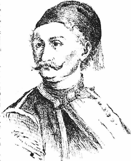
Ο Ναύαρχος Γεώργιος Σαχτούρης

Ο ύπασπιστής κατέβηκε γρήγορα τη σκάλα και ύστερ' από λίγο παρουσιάστηκε συνοδώνοντας ένα νέον άντρα, έσοφο και