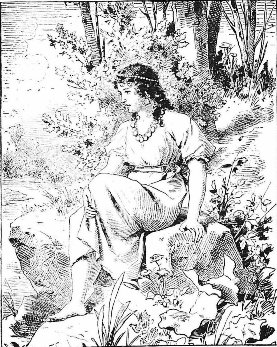
Νὰ μιὰ ὠραία κόρη, καθισμένη πάνω σὲ μιὰ πέτρα!...

—'Ο κόρη μου, κόρη μου! Τί ὠραία ποῦται τὰ χαμολούλιντα τῆς ἔξοχῆς!... Πόσο εἶνε λαμπρὰ τὰ σύννεφα τὰ χρυσαφένια τ' οὐ-