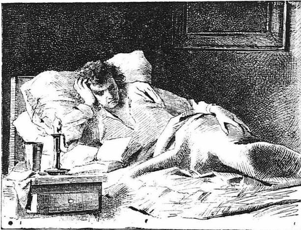
Δὲν εὗρισκε πλεὶν παρηγορίαν, παρὰ μόνον στὴ μελέτη...

— Κόψε τὴν κομμάτι-κομμάτι! Ὡ τὴν μεταφῆρῃς εὐκολότερα ἔσαι! Τὸ κοινὸ ἔξασπε τότε σὲ χειροκροτήματα. Ἡ Κλαρίς, κλαίον-