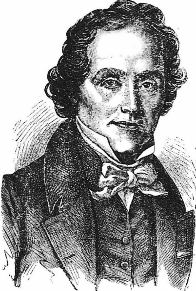
'Ο Γάλλος συγγραφέας Καζιμίρ Ντελεσιύν