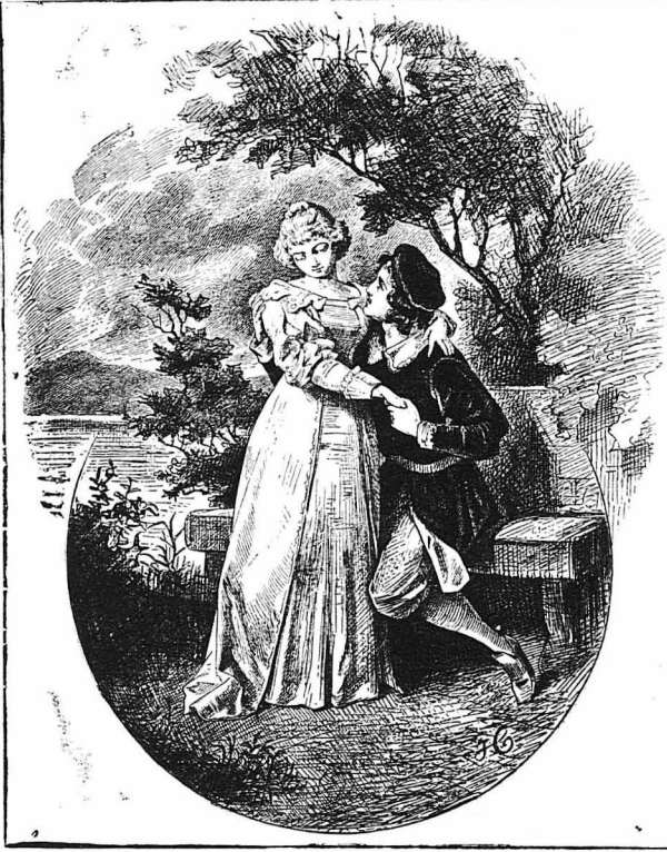
Κατέφυναν γιὰ νάνα μόνον στὴν ἐξοχή, στῆς ἐρημιές, στὰ δάση...

Μὰ σὲ τέλος κέρδιος ὁ Βιλλάρ, κί' ἀπὸ τὸ ὄφειλε στῆς ἐκκεντρικότερες του. Ἐνα βράδου π.χ. πῆγε νὰ πάη ἀπὸ τὸ θέατρο τὴν ὥραια του, ἡ ὁποῖα ἔπαυε τότε ἕνα ἀνατολιτικὸ ἔργον, ντυμένη μὲ μιὰ παραμυθῆ