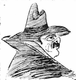
Σάν... παλιός καρφός!