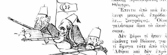
Με τούτους τούς παληότορχους δέν πρέπει πια να πολεμούμε...

Δέν έξομα τί ήταν ή εξόνοξ του Βώκου, για- τί έφωνα τότε από την Άθηναι και δέν έλα- φτασα να τις ήδω. Σία φύλλα όμως ήβλεπα ότι γινόταν σοβαρός λόγιος