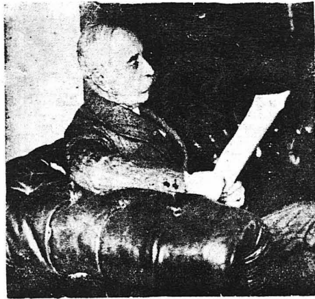
Ο Ναύαρχος Κουντουριώτης

Η Τουρκική όβιδε βοιτάει στη θάλασσα, σηκώονεν στήλες κωνημής από άφρι και νερό, χεγνάν με σφηνόματα, οβόλινα και βογγητά. Το κατάστημα και το έπιστερο του «Αβέρωφ» έχουν πλημμυρίσει στα νερά που σηκωναν τα Τουρκικά βλήματα από την θάλασσα. Μερικά θραίνματα όβιδων έχουν πέσει στο κατάστημα