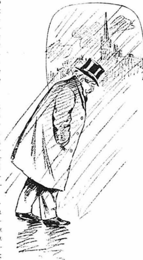
Μολονότι έβραζε μαγδαία, ο Άγκερσταίν βγήκε έξω...

Ο Άγκερσταίν δεν υπέφερε από κάποια κληρικώμαχη νόσο. Ήταν όμως φημισός και από καιρού τις κατόν έδινε σημεία μαγιάς καταδιώξεως. Στην αρχή είχε σκοπό να σκοτώσει μόνο τη γυναίκα του και να αυτοκτονήσει κι' ο ίδιος. Τους άλλους φόνους τους έκανε αι' ένα για να μην σπάσουν μαρτυρίες των εγκλημάτων του και αι' έτερον γιατί το αίμα στο τέλος τον έμεινε. Πάντως οι ειδικοί δεν απόρριψαν να βρουν σ' αυτόν στοιχεία πλήρους διανοητικής άνοστροφίας, και έτσι ο Άγκερσταίν κατεδικάσθη εις θάνατον και η γυναί' του έξετελέσθη.