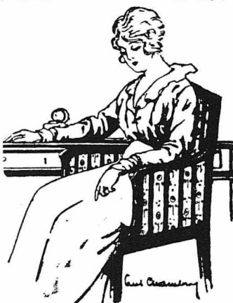
Είχε πέσει συγχωρημένη σε μια πολ- τρώνα...

Ένα πρωί τέλος, ό Ροζέ δέν βάσταζε πια κι' έφυγε για τή Μαν- τόν. Μόλις μετά δύο μέρες έφτασεν εκεί, συνάντησε στην με- γάλη λεωφόρο τού Φέλιξ - Φλώ, τή Νί- να με τή μητέρα της. — Κύριε Νταρφέ- γι, τού φρόναζε ή μη- τέρα της Νίνας, δέν μάς άναγοροξέτε;