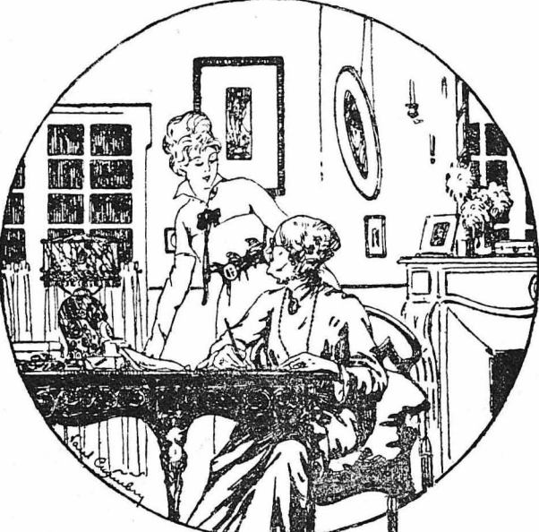
Εδρε μία γρηαία κυρία να κάθεται μπρός σ' ένα γραφείο και να μιλάη με μία έξαιρετικά όμορφη νέα...

Άλλά και ή Νίνα κούταζε μ' έκπληξη τόν Ροζέ. Περιέμενε να δη κανένα κομμοανταρτικέμο νεόλοιο ή κανένα σχολαστικέ