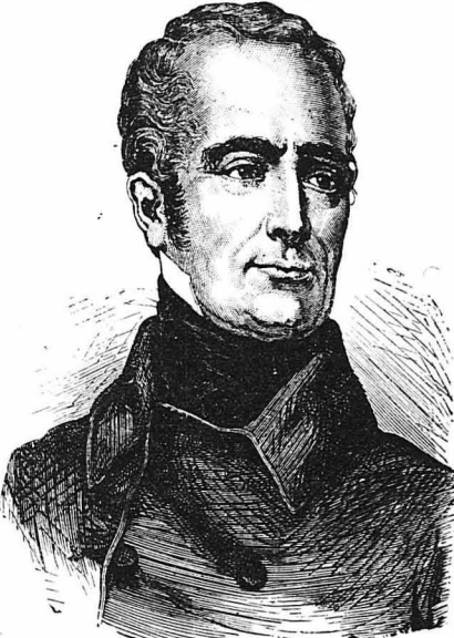
'Ο ποιητής Λαμαρτίνος