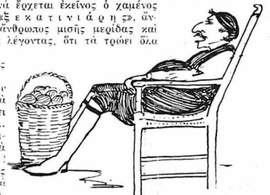
Κανείς δέν είχε τέτοια σίκα.

ΣΤΑΜ. ΣΤΑΜ. Τα φύλαγε μονάχος του νύχτα—μέρα.