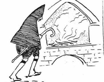
— Ένα μεγάλο εἶσακι, στο ὄποιο έκαίγε μιά δυνατὴ φωτιά.