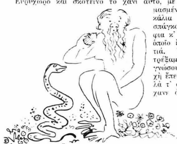
— Για τέτοιο σίκο, ας πάει κι' ο Παράδεισος, πού είχε κι' ο 'Αδάμ.

Μία ξαπνική βροχή, μάζ είχε γίνει ποτιστήριο κι' αναγιστριόκιμα να καταρτίζουμε στου Χαναλή το χάνι.