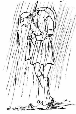
‘Ετσι πλέοντας φτασαμε άποβαδίζε στην Κοζάνη.