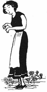
‘Η χήρα ή κακομοίρα, τόχασε.