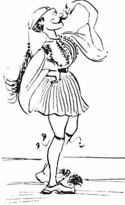
— Η μ ε ι σ, απάντησαν ό Καραγιούλας.

“Εβραζε, έβραζε με το τουλούμι, όπως λένε, οι δρόμοι είχαν γίνει αυλάκια από κοκκίνα νερά, σαν χρονοί αίματος να είχαν ανοίξει από βουτιά και να τρέχανε από