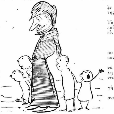
Αυτή έχει και παιδιά