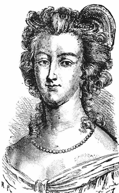
Ἡ Μαρία Ἄντουανέττα