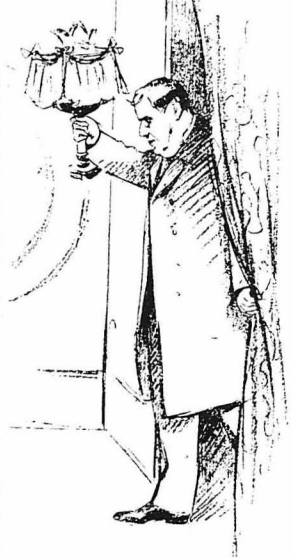
Παίροντας την ιστορική λάμπα την μετακόμισε σ' ένα άλλο δομάτιο...

Ή κνρία Περρονιέ δεν έκίστευε σ' αυτή της. Αιτός ό σοφός, ό φιλόσοφος, ό άκάματος έρευνητής νά ξέρη γι' τραγουδάη! Ό φτιχός τραπέζιτιώδης έπαυρε στο μάτια της διακόσιες μισθωροματικού ήρωος... Ό κύριος Περρονιέ έ-