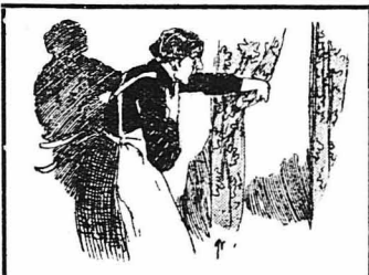
Στό κατώφλι της πορτούλας αυτής, πίσω από ένα μπερνετί, φάνηκε τότε μία γρηά...

Τί άτέλειαν κωούπε τήν τρωική αυτή συμμορία ή άι σίς τή διηγήθεισε στό άλλο φύλλο.