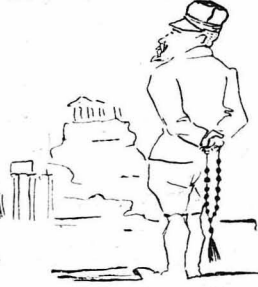
Ευτυχώς εξεργάγη του Γουδιού το κίλημα.