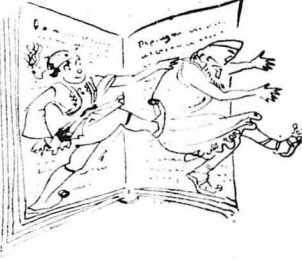
Νά τον πετάξουμε κλωτσιές έξω από τις σελίδες της 'Ιστορίας.