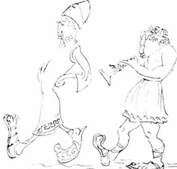
Νά ηγαινή από πίσω και να διαλαλή πως εινε «δικαιος»!

Β'. Τότε ο πατριάρχης ο Καρακούλας έπενεθε. Για σίτισον βρε αδερφέ, που λέει, να μη γίνουμε φρέλι. Δεν μάς λες, σαν τί είδους 'Ιστορία 'Ελληνική θα βάλεις στα σχολεία :