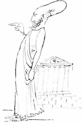
Πού ήταν το κεφάλι του, σαν χειμωνιατικό πεπόνι.