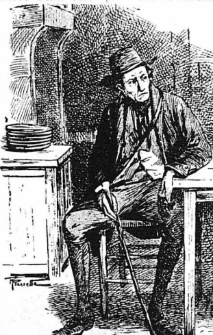
'Ο ταγματάχης είχε γυρίσει άπ' τó κνήνη και καθόταν κοντά στη φωτιά...

Σιγά—σιγά τά χρόνια περάσανε. Κι' όταν, ό