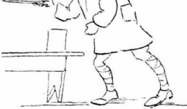
Αγγά τηγανισμένα με κοκκινοπιπερο !...

Εφίσηκε μέσα κανείς σπάγγους, σίκα, θειαφοκέρια, κάνουλες, αγγά, λουμίνα, έλλης και... πρόκες για πετάλιωμα. Υπήρχαν ακόμα διού-τροις μουκαλές ούζο και κωνιά και ο κατάμαυρος εσαράπα-λας στη φωτιά, που έβραζε το νερό για τους καφέδες.