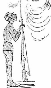
Ένα άστρο κρυφοκίταζε από τόν ούρανό.

Ήταν νύχτα άκόμα, βαρεία διά χειμωνιάτικη. Άπάνω, από τόν συνεμασμένο ούρανό, ένα άστεράκι κρυφοκίταζε από κάποια σιγιάμα ότων συννέφων. Κάτου-κάτου, μέσα στό χωριό, κανένα σκυλι γαύγιζε, άπαντώντας άγνωστον σε ποιους κρυφούς της φήσεως θούδους... Άπό τόν διπλανό τό σταύλο άκουγόntonσαν, από καιρό σε καιρό, τ'ά ποδοτυτήματα τών ζώων και μέσα στό καφενείο ροχάλιζαν βαρεία, σιγιά οι Άρβανίτες μπέηδες.