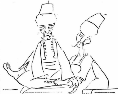
Οι Άρβανίτες Μπέηδες είχαν μεθύσει !...

ριπώσι, πώς να εινε εκεί άπάνω ο Καστόλδης; Νά έχη διού πόδια και χονδρά, σφαιροειδή, έξέχοντα νότα και αυτός, ή να εινε κερμαίνος σάν άραχνη, για να σκαρφαλώνη καλύτερα στα πατάβια;