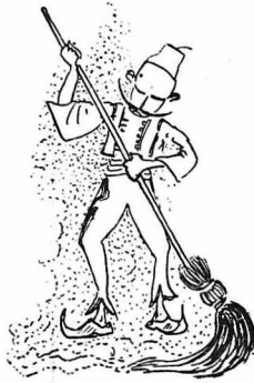
Ο Μανραντζιάς τους έβαλε να σκουιζούν τους θούρους της Έρσεκιάς.

Έδω άναπαύεται βαθεία μέσ στην κόποινα κυρία πιστή στην ήθονη, που δίχωσ νάχη στις Γραφές έμ-πιστοσύνη (πιστοσύνη) γνώρισε τόν Παράδεισο στη γή.