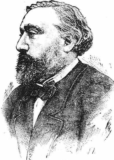
Ό Λέων Γαμβέτας