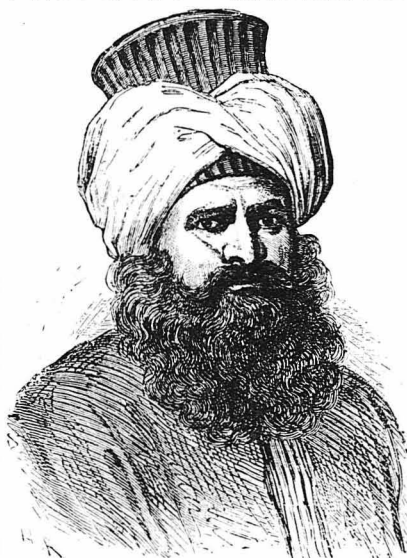
Ὁ Ὁσμάν Πασᾶς

Ὁ Ὁσμάν Πασᾶς ἔμεινε κάμποσα χρόνια ἀκόμη στὴν Κρήτη. Ἐπειτα τὸν ἀνέκλεσε ὁ Σουλτάνος καὶ τὸν ἔστειλε στὴν Προύσα, διὰτι ἔπρεπε, λένε, σὲ δυσμένεια