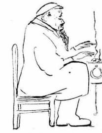
Κ' ό κακομοίρης ό Μπελινόχης