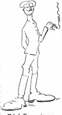
Κ' ό Γερμανός ψυχρός και δίκαιος.

Και έτσι ενώ όλη τήν ήμέρα έκτελούσα με πρωτοφανή ταχύτητα και πειθαρχία, σάν να μήν ήμιον Έλληνας, τά παραγγέλματα των Ευρωπαίων, τó βράδυ καθάλίκενα στραύλογο, Ξεπειρα κι Ξνα Βορειοηπειρώτη στρατιώτη, πού ήξερε τούς δρόμους, έτρεχα στά χωριά πού θα πηγαίνο ή Έπιτροπή τήν άλλη ήμέρα, αναγκάουσα τούς πορχίτους, βάταμε τις βάσεις τής αόριανής ενεργείας τού χωριού, και τó πρωί Ξημέρινα φρέσος κι έτοιμος, στην πόρτα τής Έπιτροπής, για να τή συνδεούσα και έπιβάλλω τάς θελήσεις της... ***