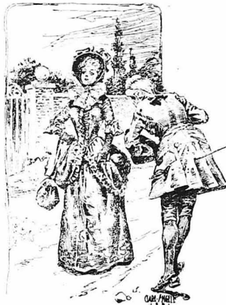
Συνάντησε τη δούκισσα καθώς έβγαίνε από την έκκλησία...

όχιως να της κάνει παρατηρήσεις, μόλις βρέθηκε μόνος μαζί της. Της έσοφισσε με λίσσα τα λεπτά δαχτυλά της και με φαινομενική ευγένεια στην έκφρασή του, της έκανε μια τρομερή σκηνή στο δρόμο. Έτσι την άδήςσε ως τού μέγαλό της, όπου ή δούκισσα έπεσε λιπόθυμη από την ταραχή της.