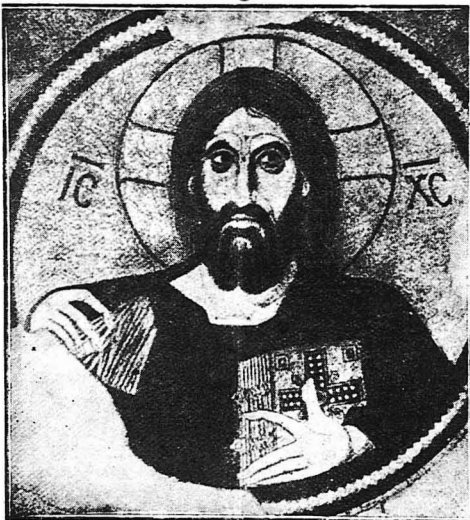
Ο Παντοκράτωρ του Δαρνιοῦ