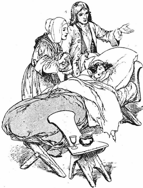
‘Όταν κοιόταν στο κρεββατάκι του, ήπό την έπίβλεψη των δύο έκείνων φτωχών άνθρώπων...

— Άκουσε με λοιπόν, συνέχισε ο σκληροκαρδός γιος του Κοντσαύλου. 'Ο Φραγκίσκος... ό αδελφός μου... ό Φραγκίσκος... Ξ, λοιπόν, ό Φραγκίσκος ζή και αρτανει σε λίγο. Φτάνει άπό στιγμή σε στιγμή. Διάταζε νά του πούν νύχρη εδω. Μόλις έρθη, θα τό μιλήσω μπροστά σου και θα του πω ότι μού άρσει. Άν πής ότι λέω ψέμμα-