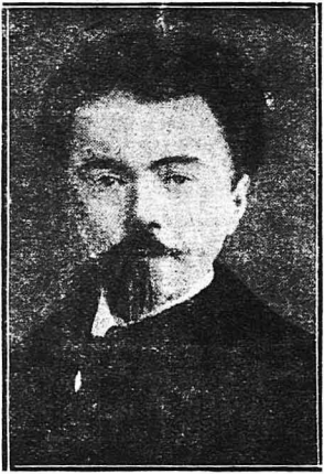
Ὁ Βιλλιέ ντὲ Λ' Ἰλ—Ἀντάν