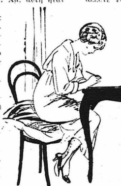
...Ὅλα πᾶνε καλά, ἡ δουλειῆς τοῦ Τζῆμ προζοῖσθῶνε, τοὺς ἔγραφε.

Ὁ μῶσες πηγαυοερχόνταν ὄρες ἀλόφωρες, καὶ ὅταν τέλος ἡ παρῆα χᾶλασε, καὶ ὁ Σεφλιούδας κινωοσε νὰ πᾶθῃ σπῆτι του, ἢ βενετανῆνὴ πετροκόκαλα τῆς