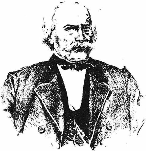
Κωνσταντῖνος Κανάρης (Κατὰ τὸ γῆρας του)