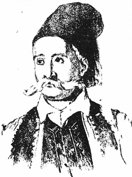
Ο Πετρόμπεης Μαυρομιχάλης

«Διό παρακαλοόμεν την συνδρομήν όλων των έξευγενισμένων Εύρωπαικών γενών, ώστε να δυνηθώμεν να φθάσωμεν ταχύτε-